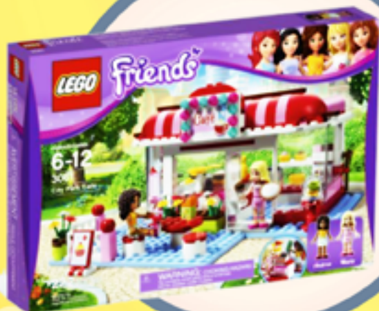
68. ZABAWKA LEGO