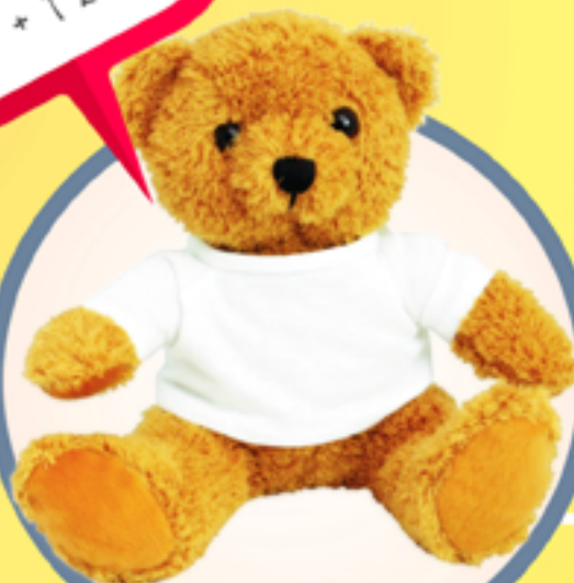
69. PLUSZOWA MASKOTKA